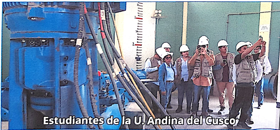
Estudiantes de la U. Andina del Cusco