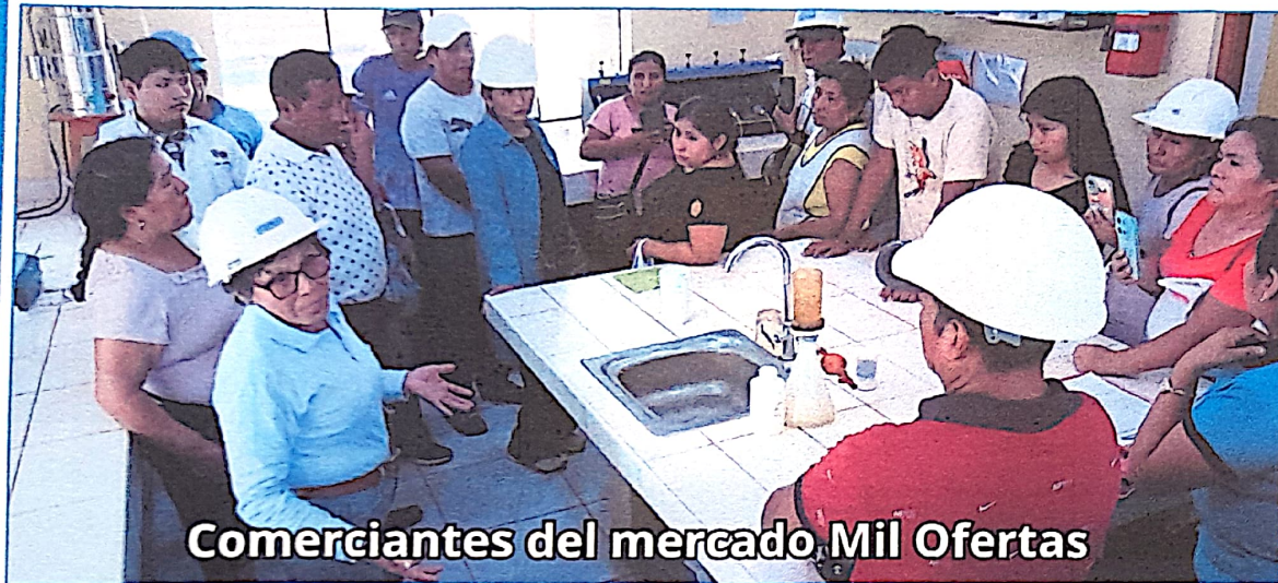
Comerciantes del mercado Mil Ofertas