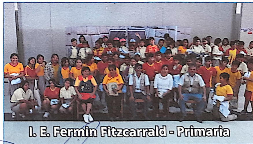
I. E. Fermin Fitzcarrald - Primaria