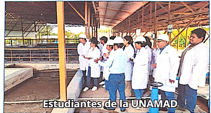
Estudiantes de la UNAMAD