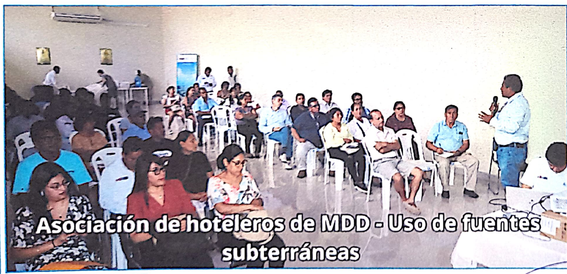
Asociación de hoteleros de MDD - Uso de fuentes subterráneas