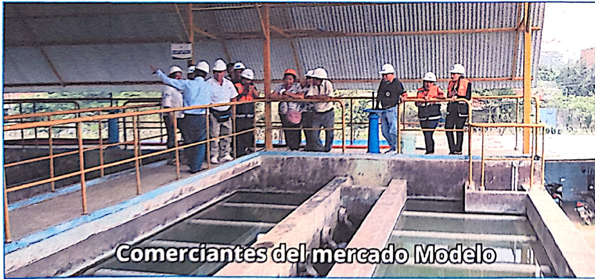
Comerciantes del mercado Modelo