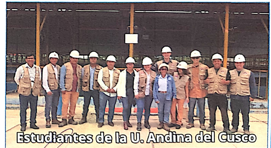
Estudiantes de la U. Andina del Cusco