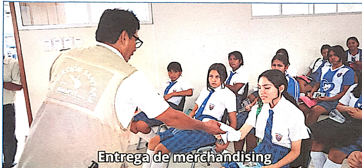
Entrega de merchandising